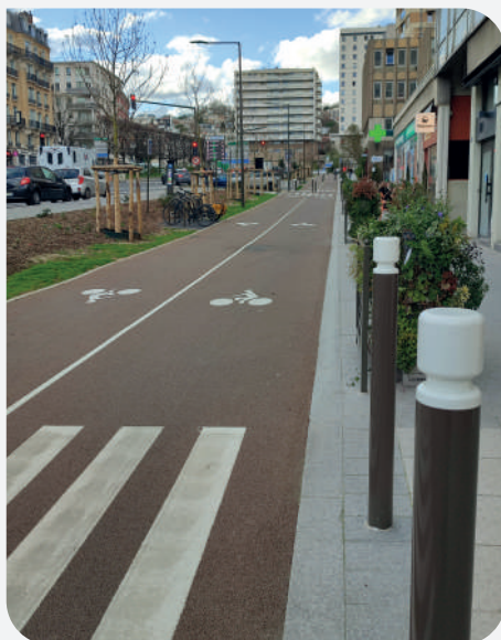
Piste cyclable bidirectionnelle.

Les trottoirs seront élargis et végétalisés.