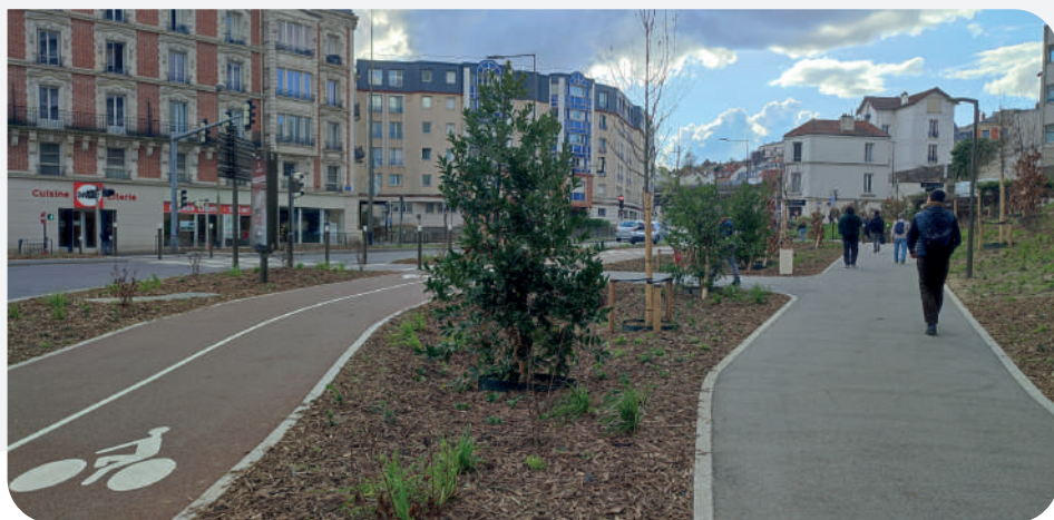
Les nouvelles plantations du bosquet côté ancien office de tourisme.

La requalification côté nord du boulevard Henri-Sellier s'est achevée cet hiver par trois séries de plantations : des arbustes (Savonniers) plantés le long de la contre-allée, un chêne chevelu ou dit de Bourgogne sur le rond-point, avec au pied une végétalisation en strate basse. Enfin, la plantation du bosquet (arbres/arbustes/vivaces) a été réalisée en février au niveau de l'ancien office de tourisme.