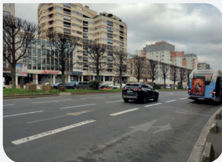
Actuelle chaussée côté sud.

Côté sud de la voirie dans le sens Suresnes vers Paris, la circulation sera maintenue pendant toute la durée du chantier, avec des restrictions de voies possibles en fonction de l'avancée des travaux [rétrécissements de chaussées, déviations, modifications des plans de feux].