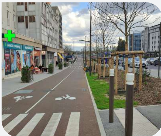
Traversée piétonne et bande végétale.