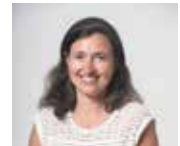
Sophie de Lamotte Lecture publique, Musique, Danse, Arts plastiques, Cinéma, Commande publique et Plan vélo