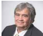
Louis-Michel Bonne Fêtes, Événementiel et protocole, Fêtes foraines, Vie des associations et Tourisme