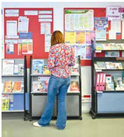
↑ Études, emploi, formations, loisirs vacances... le SIJ dispose d'une documentation riche et variée.

Pour bien grandir, il faut être bien dans sa peau ! Avec le soutien de la Ville et la participation de l'Association du site de la Défense (ASD), Suresnes information jeunesse (SIJ) met en œuvre de nombreuses actions pour assurer aux jeunes une bonne santé mentale et physique.