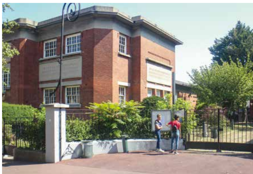
↑ Le lycée Paul Langevin, dont la construction date de 1927.