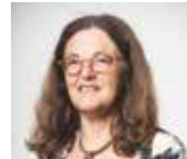
Florence de Septenville Seniors, Accompagnement social et Handicap