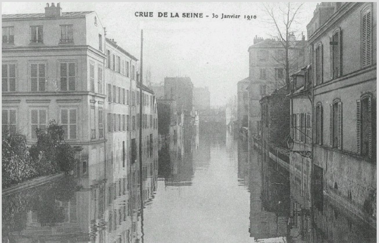
Inondations Janvier 1910

Archives Départementales des Hauts-de-Seine