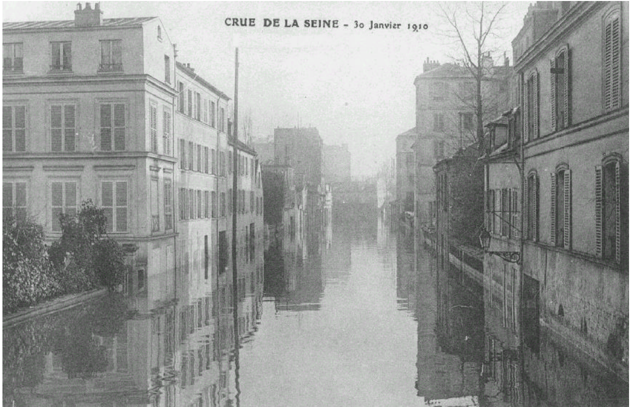
Inondations Janvier 1910