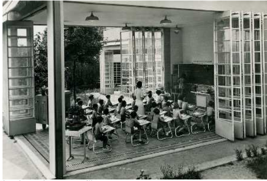
La classe dans un pavillon