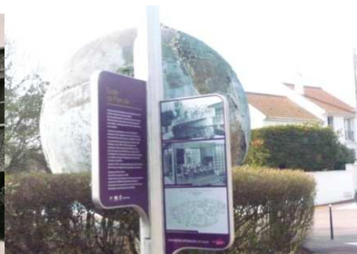
Aujourd'hui signalé par un mat du Parcours patrimoine