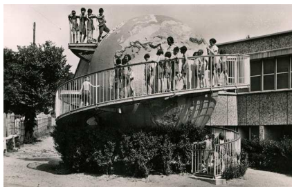
Leçon autour du globe terrestre en 1935

(*) INS HEA : Institut national supérieur de formation et de recherche pour l'éducation des jeunes handicapés et les enseignements adaptés