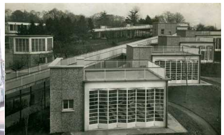
Vue de l'École de plein air