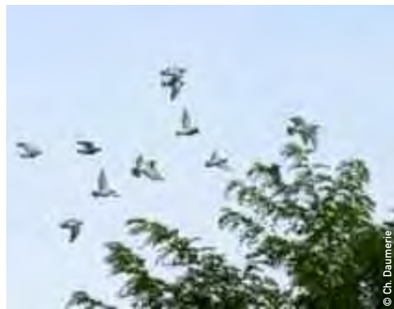
Vol de pigeons voyageurs au-dessus du Mont-Valérien.