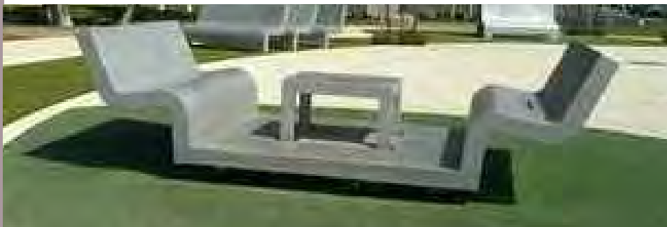
Sculpture dans un jardin public, Holon.

Hann-Münden (Allemagne), du 18 avril au 3 mai