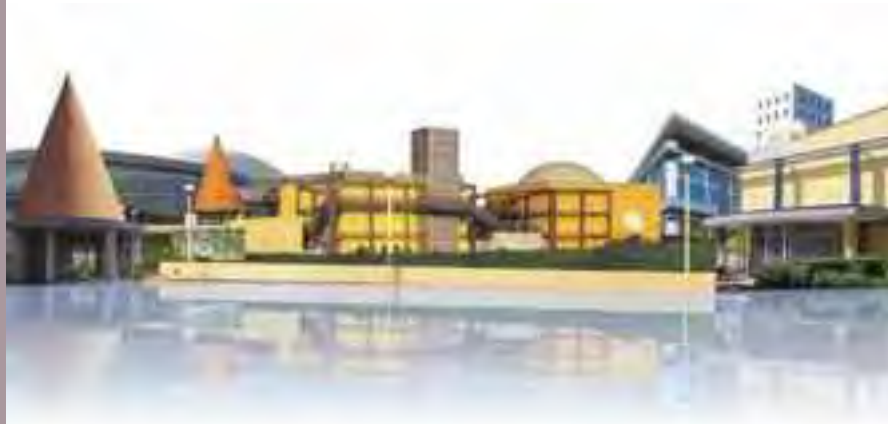
Musée de l'enfance, Holon.