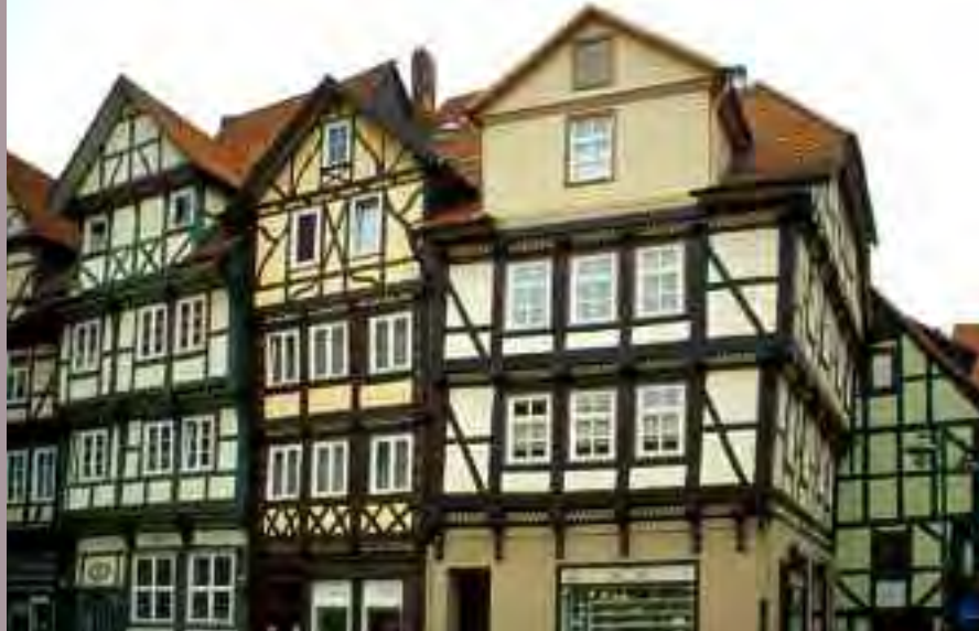
Façades à colombages, Hann-Münden.

Dans le cadre des dispositions de l'article L.52-1 et suivants du code électoral, l'éditorial de Christian Dupuy est suspendu jusqu'aux élections municipales de mars 2008.