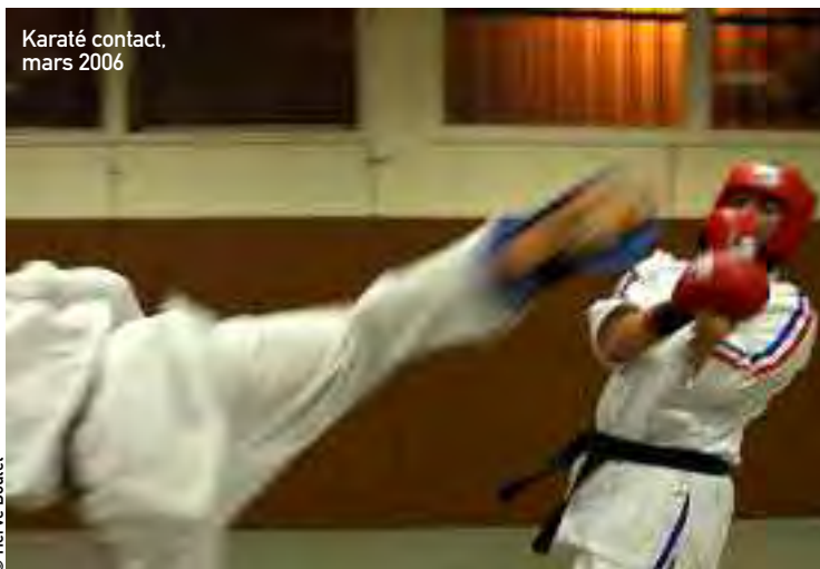
Karaté contact, mars 2006