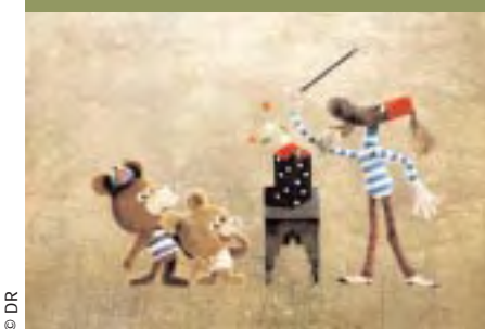
Monsieur et Monsieur