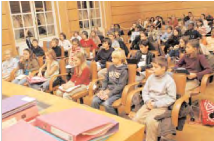
De jeunes élus attentifs, salle du conseil municipal.